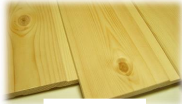
【t9 mm 目透Mタイプ】