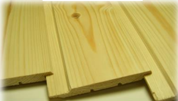
【t12 mm 目透Mタイプ】